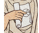
La lettre des martyrs